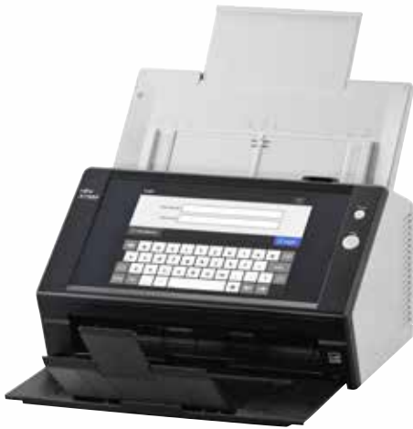
A4-Hochformat mit 300 dpi: 25 Seiten/min bzw. 50 Bilder/min Scannen von gemischten Stapeln bis zu 50 Blatt