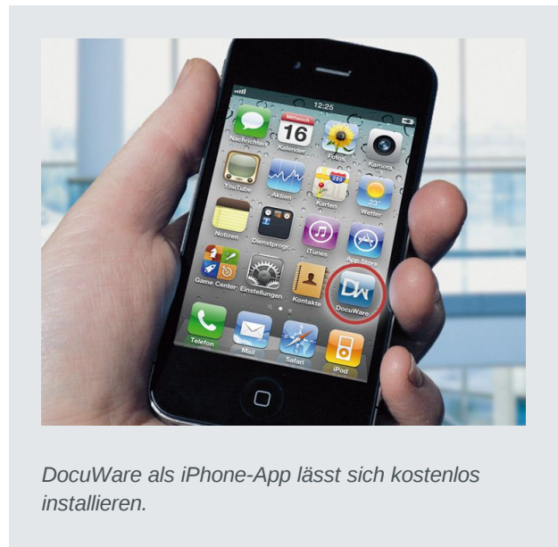
DocuWare als iPhone-App lässt sich kostenlos installieren.

DocuWare Mobile lässt sich mit zahlreichen mobilen Geräten nutzen, so etwa mit dem iPhone, iPad, iPod, auf BlackBerry-Smartphones, auf Geräten mit Windows Phone 7 und Android sowie Tablets mit Windows 8. Der Funktionsumfang kann sich je nach Gerät und Betriebssystem leicht unterscheiden. Bei den mobilen Geräten von Apple haben Sie die Wahl, ob Sie auf das Dokumenten-Management über die App DocuWare Mobile zugreifen oder über einen HTML-5-fähigen Browser wie Safari. Die Installation entfällt beim Browserzugang, jedoch kann die App in der Regel schneller arbeiten als dies per Browser möglich ist. Für BlackBerry- und Android-Geräte ist nur der Browser-Zugang verfügbar; Smartphones mit Windows Phone 7 sowie Tablets mit Windows 8 arbeiten nur mit der App. Mehr Informationen zu Versionen und Funktionen finden Sie unten im Kasten „10 Fragen“ sowie im DocuWare Knowledgecenter unter help.docuware.com/de/#t56052